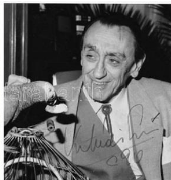
Kibédi Ervin színművész dedikált fotó. Karsai Sándor fotója 18x12 cm