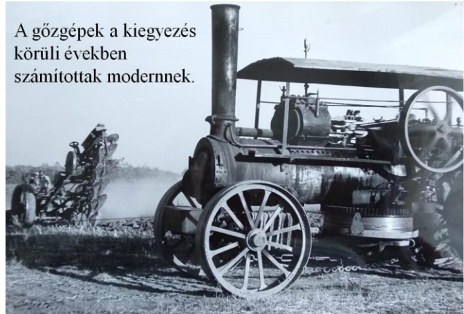
A gőzgépek a kiegyezés körüli években számítottak modernnek.

A másik tárlat a mezőgazdaság magas színvonalú gépesítéséről szóló sajtótudósítás mellé készült fotókból készült. A képeken szereplő 19. századi gőzgépek a 20. század 50-es éveiben már nem számítottak modern technikának. A sajtó ezekről a problémákról nem számolhatott be, azonban Karsai [Karai] Sándor fotói megőrizték a nyomorúságos valóságot.